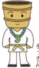
ハニワこうてい そっきん

ちょっとあやしいキャラも... イベントだいじょうぶかな~ あっ、ハニワこうていさまの ことじゃないですよ!