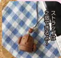
ミニ埴輪ストラップ